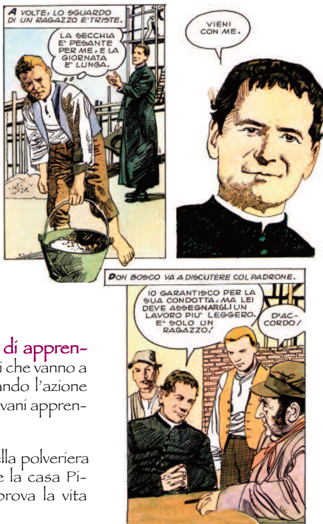
Vignette da: T.BOSCO - A.GATTIA, Storia di Don Bosco, Elledici In vendita nelle Librerie Salesiane

1852 Lo scoppio della polveriera semi-distrugge la casa Pinardi, e mette a dura prova la vita dell'Oratorio. educare