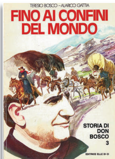
Albo a colori di pagg. 48 TERESIO BOSCO - ALARICO GATTIA Fino ai confini del mondo , Elledici In vendita nelle Librerie Salesiane

... 31 gennaio. Don Bosco muore all'alba. Prima di morire mormora: «Dite ai miei ragazzi che li aspetto in Paradiso». educare