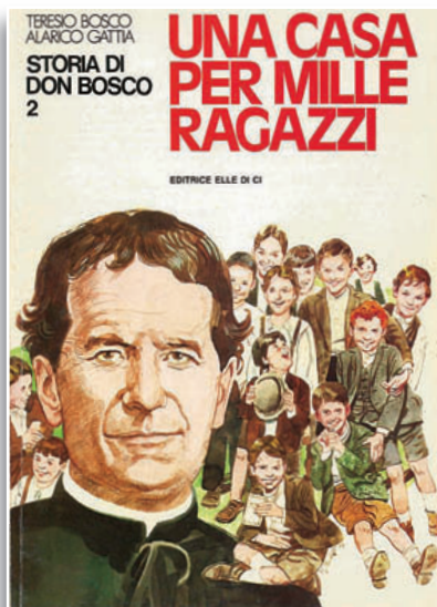
Albo a colori di pagg. 48 TERESIO BOSCO - ALARICO GATTIA Una casa per mille ragazzi , Elledici In vendita nelle Librerie Salesiane

Fu il primo catechista dell'Oratorio e Don Bosco ne aveva predetto la morte nel gennaio precedente (Af. B., IX, 287-289).