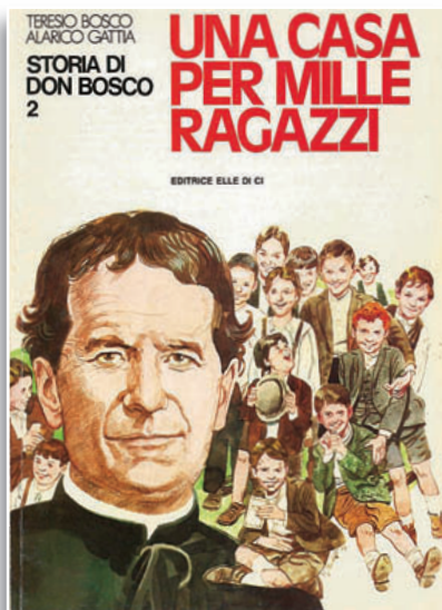
Albo a colori di pagg. 48 TERESIO BOSCO - ALARICO GATTIA Una casa per mille ragazzi , Elledici In vendita nelle Librerie Salesiane