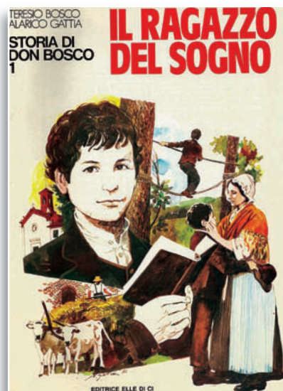
Albo a colori di pagg. 48 TERESIO BOSCO - ALARICO GATTIA Il ragazzo del sogno , Elledici In vendita nelle Librerie Salesiane