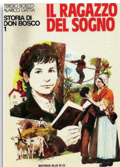
Albo a colori di pagg. 48 TERESIO BOSCO - ALARICO GATTIA Il ragazzo del sogno , Elledici In vendita nelle Librerie Salesiane